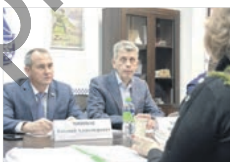
• Приём граждан — важная часть депутатской работы.

По некоторым обращениям решения были приняты сразу же, на месте. Одно из них касается согласования с министерством энергетики и жилищно-коммунального хозяйства Нижегородской области переноса сроков