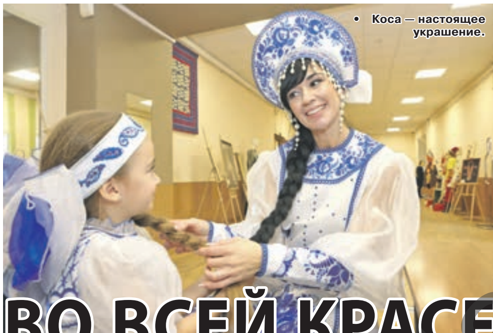
• Коса — настоящее украшение.

— Я горжусь тем, что могу продолжать эти традиции. Хотя это, конечно, труд, — признаётся девушка. — Требуется время для ухода. После мытья волосы сохнут около часа. Феном не пользуюсь, боюсь их повредить. Расчёсывать бывает трудно. Шея устаёт, если коса долго лежит на плече — она тяжёлая. Но я не считаю это трудностями. Красота того стоит! Можно две косы заплести, сделать «колоски», пучок, хвост. Но мне больше